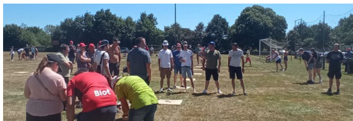
Le concours de palets à Visseiche le 10 Juillet 2022

De nombreux lots pour ce rendez-vous incontournable de l'Été pour les joueurs de palets !