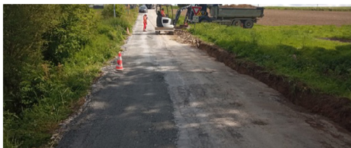
Travaux route de la Gérardière Mai 2023

Le total des travaux de rénovation de la Route de la Gérardière pour 2023 s'élève à 43 359,75 € HT soit 52 031,70 € TTC.